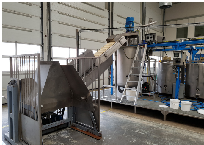
Figuur 2: Verwerkingsinstallatie ABC Kroos

Voor hoogwaardige toepassingen van eendenkroos is gekeken naar de inhoudsstoffen van eendenkroos. Eendenkroos kan geraffineerd worden waarbij eiwitten (bestaande uit aminozuren) en koolhydraten (voornamelijk zetmeel) en lipiden vrij komen. Om de afzonderlijke inhoudsstoffen uit eendenkroos te halen zijn verschillende technieken nodig. Bij Avans is op laboratoriumschaal onderzocht welke technieken hiervoor het meest geschikt zijn. Aandachtspunt hierbij was dat de techniek voor raffinage van de ene inhoudsstof geen negatief effect mocht hebben op de raffinage van de andere inhoudsstof. Op basis hiervan is een roadmap voor de raffinage van eendenkroos ontwikkeld waarbij eerst zetmeel en vervolgens eiwitten en lipiden worden geraffineerd. Deze roadmap moet nog op grotere schaal worden getest. Bij ABC Kroos is de raffinage van alleen eiwit succesvol getest. Dit is gebeurd in een verwerkingsinstallatie met een capaciteit van meer dan 200 kg per uur volgens het door ABC Kroos ontwikkelde en gepatenteerde verwerkingsproces.