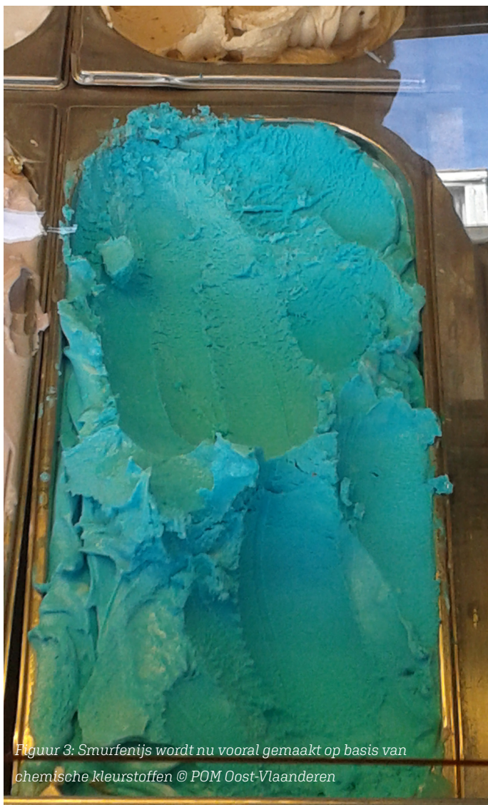
Figuur 3: Smurfenijs wordt nu vooral gemaakt op basis van chemische kleurstoffen