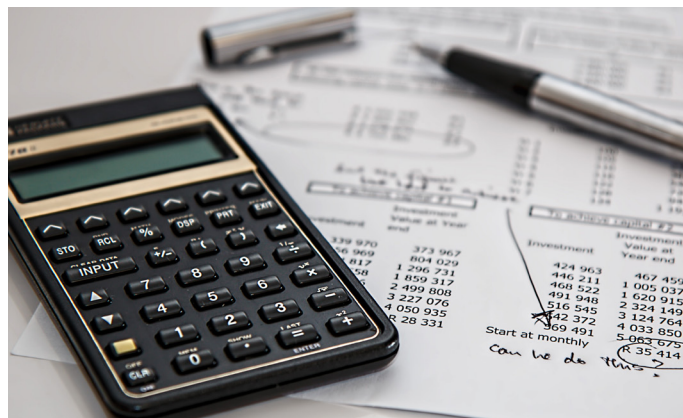
Figuur 2: Een rekentool werd ontwikkeld door POM Oost-Vlaanderen

Een belangrijk deelmodel van de rekentool vormt het logistiek rekenmodel. Er werd in het project immers uitgegaan van decentrale productie van kleine volumes Spirulina in kassen. Het is van belang dat de logistieke stromen omtrent inzameling zo efficiënt mogelijk worden uitgevoerd. Beide tools staan ter beschikking voor alle geïnteresseerde partijen. Hiervoor kan contact opgenomen worden met POM Oost-Vlaanderen.